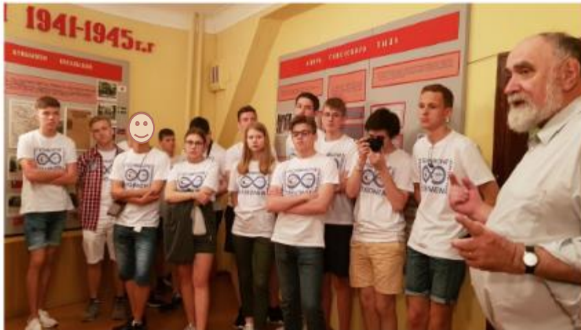
Im Stalin Bunker