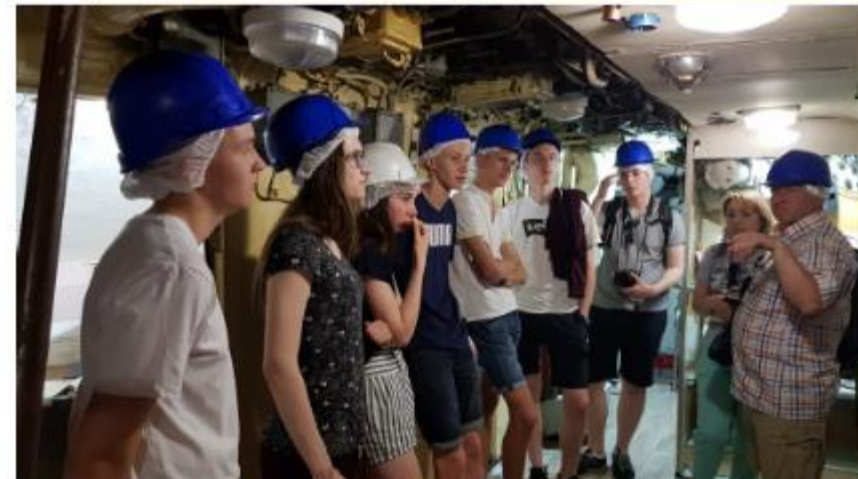
Im Technischen Museumspark in Togliatti