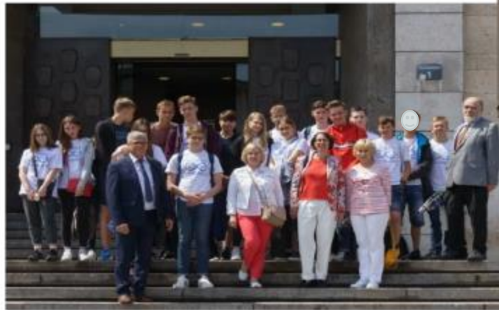
Empfang im Rathaus