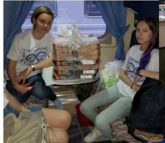
Pizza zum Geburtstag im Nachtzug nach Samara