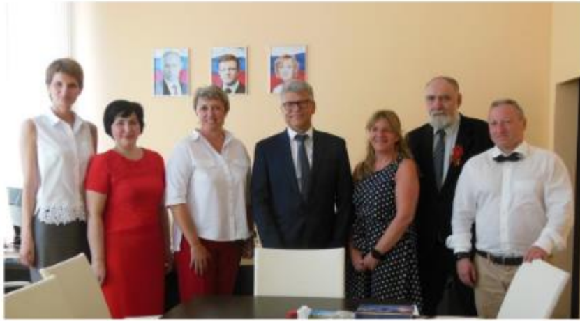
Empfang im Rathaus in Samara