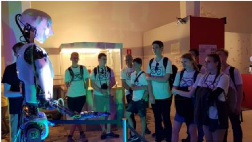
Robotikausstellung auf dem WDNCh Gelände