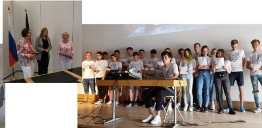
Abschlusspräsentation in der Aula der MES